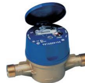
Табела за дистрибуција на вода-физички лица